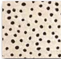
Acercamiento de los túbulos dentinales abiertos