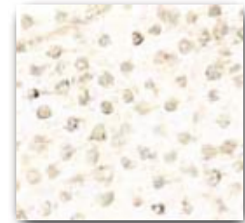
Colgate Sensitive Pro-Alivio ayuda a obturar los túbulos para bloquear la transmisión del impulso doloroso